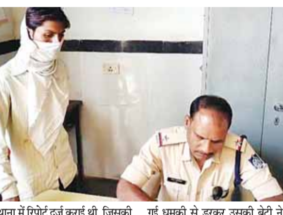
नाबालिग दुष्कर्म पीड़िता ने जहर खाकर दी जान

पिता ने आरोपी की पत्नी पर लगाए धमकाने के आरोप छतरपुर। सोमवार को जिला अस्पताल में इलाज के लिए लाई गई एक नाबालिग लड़की ने इलाज के दौरान दम तोड़ दिया, जिसके बाद उसके पिता ने बताया कि कुछ माह पहले एक व्यक्ति ने उसकी बेटी के साथ दुष्कर्म किया था, जिसके लिए पुलिस ने आरोपी को गिरफ्तार कर लिया। बीते रोज आरोपी की पत्नी घर पर आई थी और उसके जाने के बाद बेटी ने जहरीला पदार्थ खा लिया, जिस कारण उसे उसकी मौत हुई है। मामला पड़ोसी राज्य उत्तरप्रदेश के अजनर थाना क्षेत्र के एक गांव का है। मृतिका के पिता ने बताया कि 1 जून 2025 को गांव के एक व्यक्ति ने उसकी बेटी के साथ जबरन दुष्कर्म किया था। 2 जून को उसने अजनर