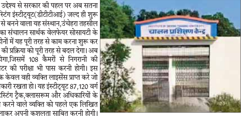
अत्याधुनिक ड्राइविंग टेनिंग एंड टेस्टिंग इंस्टीट्यूट