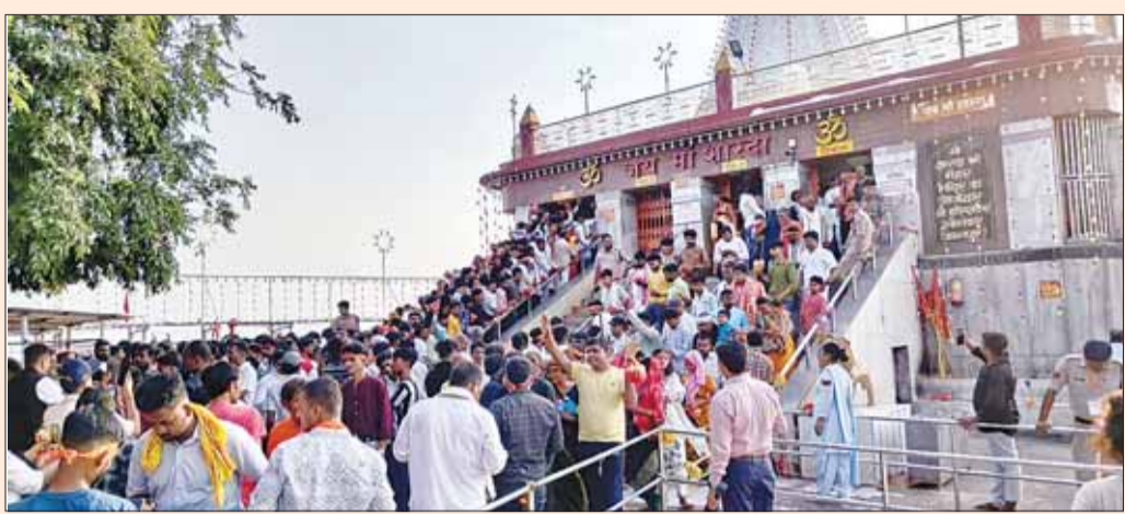
पुलिस बल की व्यवस्था की गई है। शहर में कई स्थानों पर विशेष जांच चौकियां भी बनाई गई हैं।